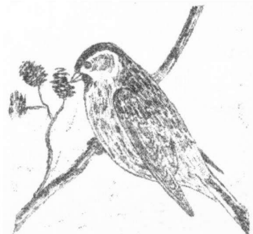
Carduelis spinus (tek. E.P.Klomp)

Een merelvrouw zonder echtgehoort bouwde een nest in de hulst bij de keukendeur en legde er drie eieren in. Ze had wel koket gedaan tegen onze merelman, die elk jaar een nest op het mezenkastje aan de muur heeft, maar werd meestal door diens vrouw verjaagd. Na een paar dagen broeden gaf ze het op.