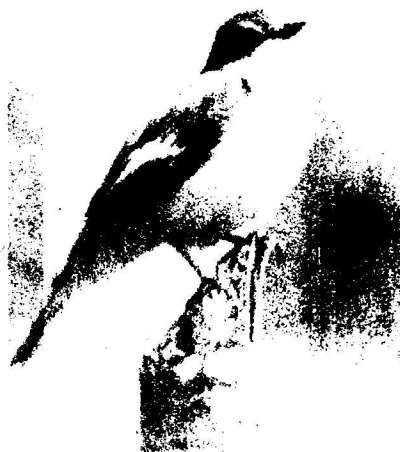
Ficedula hypoleuca