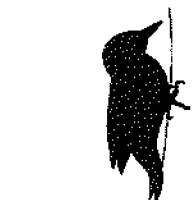
grote bonte specht