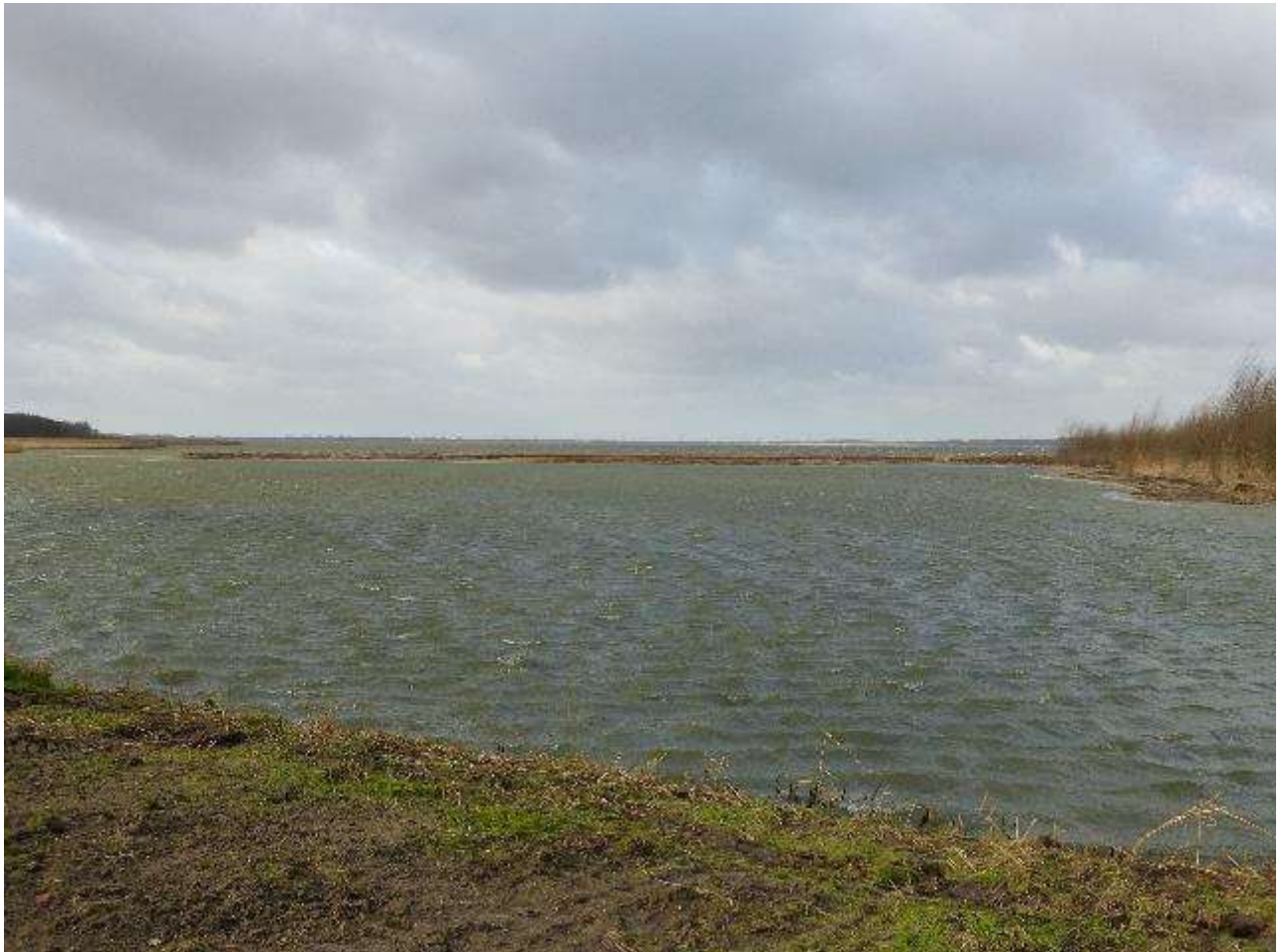
Zicht vanaf de pier op het eilandje voorjaar 2015

Omdat zowel de gemeente als de Vogelwerkgroep benieuwd zijn naar de ontwikkelingen van het vogelbestand op en rond het eiland zijn in dit rapport de waarnemingen van alle jaren vergeleken.