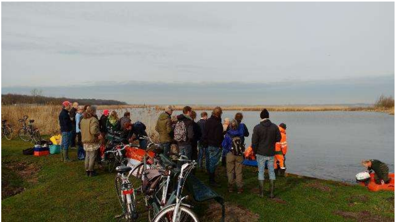
Start werkzaamheden 11 maart 2017