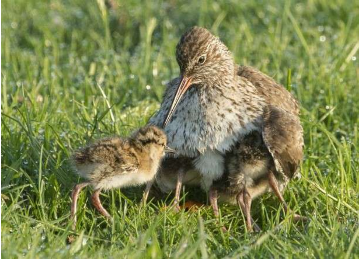
Tureluur met kuikens- (Bron: R.J. vd Leij)

Als de tureluurkuikens eenmaal uit het ei zijn gekomen, blijven ze vaak binnen een straal van zestig tot honderd meter van het nest. De ouders zijn erg plaatstrouw en maken hun nest vaak op dezelfde plek. Zo leren ze hun gebied door en door kennen. In tegenstelling tot veel andere weidevogels, groeien de kuikens van de Tureluur vooral op plekken op waar minder maaimachines komen, zoals (greppel)plasdrassen, slootkantjes en braakliggende stukjes. Ook zijn de ouders behendig in het wegleiden van de kuikens, waardoor ze maaimachines kunnen ontwijken.