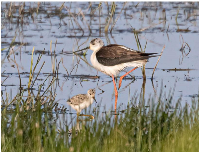
Steltkluut met kuiken

Ook hadden we 3 nesten van de steltkluut in onze polder. Met vliegvlugge kuikens. Dit jaar zijn er veel broedende steltkluten gemeld in ons land. Inmiddels is duidelijk dat er ruim 100 broedparen zijn geweest. Dit is een record want de beste jaren waren tot nu toe 2021 met 81 en 2022 met 82 broedparen.