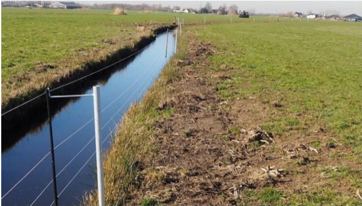
Vossenraster in Eemland: een hekwerk dat onder stroom staat om vossen uit dit weidevogelgebied te houden.

Zijn de maatregelen dan tevergeefs? Nee, veel beschermingsmaatregelen hebben wel degelijk succes.