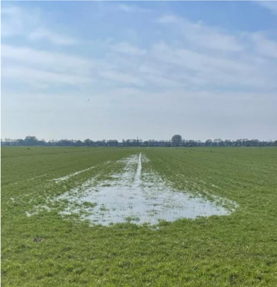
Plas dras situatie

"Echte" weidevogels eten met name regenwormen, larven, emelten en andere insecten die ze in de grond vinden. Net zoals andere trekvogels vliegen ze elk najaar naar zuidelijke streken, bijvoorbeeld naar Portugal en Mauritanië. Tijdens deze trek stoppen ze om op kracht te komen op zogenoemde pleisterplaatsen. Hierna trekken ze verder naar de overwinteringsgebieden en hier blijven ze tot het voorjaar, om extra vet op te slaan en conditie op te bouwen. Deze plaatsen zijn van cruciaal belang voor de overleving van de populatie. De Kievit is meer een korte- en middellange-afstandstrekker, pendelt heen en weer met vorstgrens. In zachte winters overwinteren grote aantallen in ons land. Bij vorst trekken veel Kieviten naar Engeland en Frankrijk.