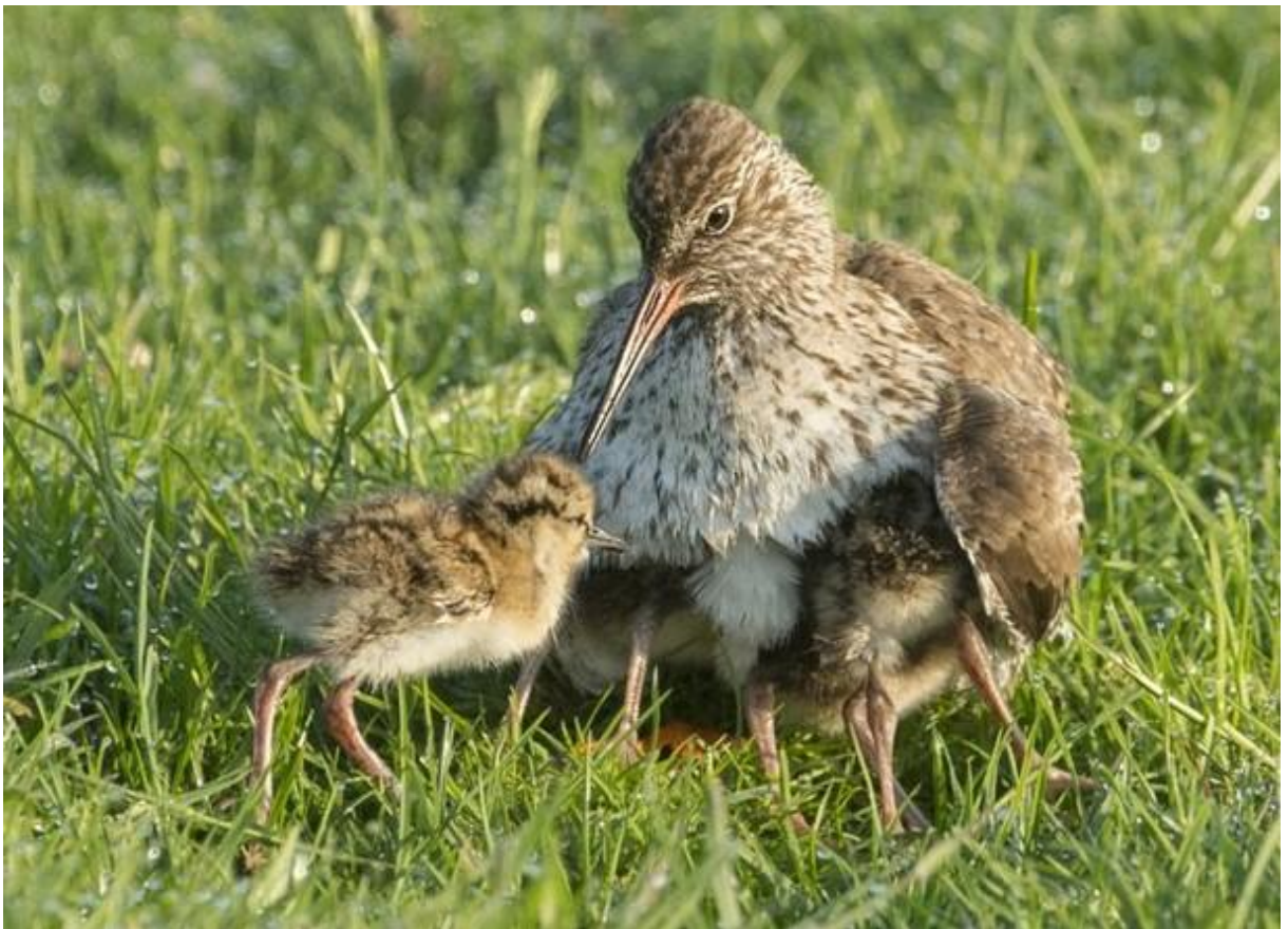
Tureluur met kuikens

Hoewel het hele jaar in ons land aanwezig, is de Tureluur in juli en augustus minstens tweemaal zo talrijk als in de rest van het jaar. In de nazomer trekt een deel van onze broedvogels weg terwijl de rest in de getijdengebieden vertoeft. Hier krijgen ze gezelschap van Tureluurs uit Noord-Europa. Midden in de winter zijn de aantallen het laagst; de overwinteraars zijn in meerderheid afkomstig uit IJsland. Strengere vorst zorgt voor gedeeltelijke wegtrek, terwijl er onder de achterblijvers veel slachtoffers vallen. De voorjaarsstrek begint in maart, wanneer ook de eigen broedvogels terugkomen, en bereikt een top in mei, wanneer noordelijke vogels doortrekken. De landelijk getelde aantallen schommelen al decennialang zonder duidelijke trend.