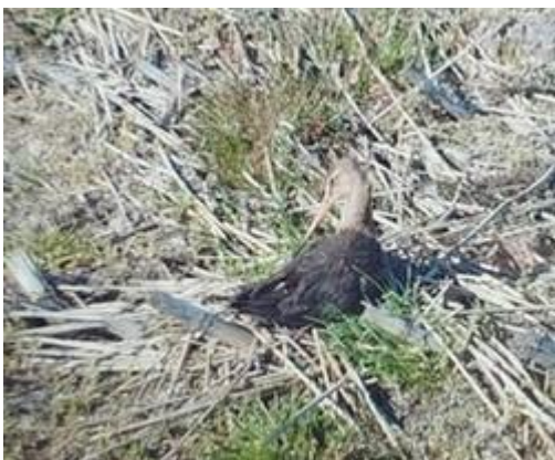
Grutto op nest kievit

We hadden bij Gertjan van Oostrum een broedende grutto op het nest van een kievit. Heel bijzonder!!