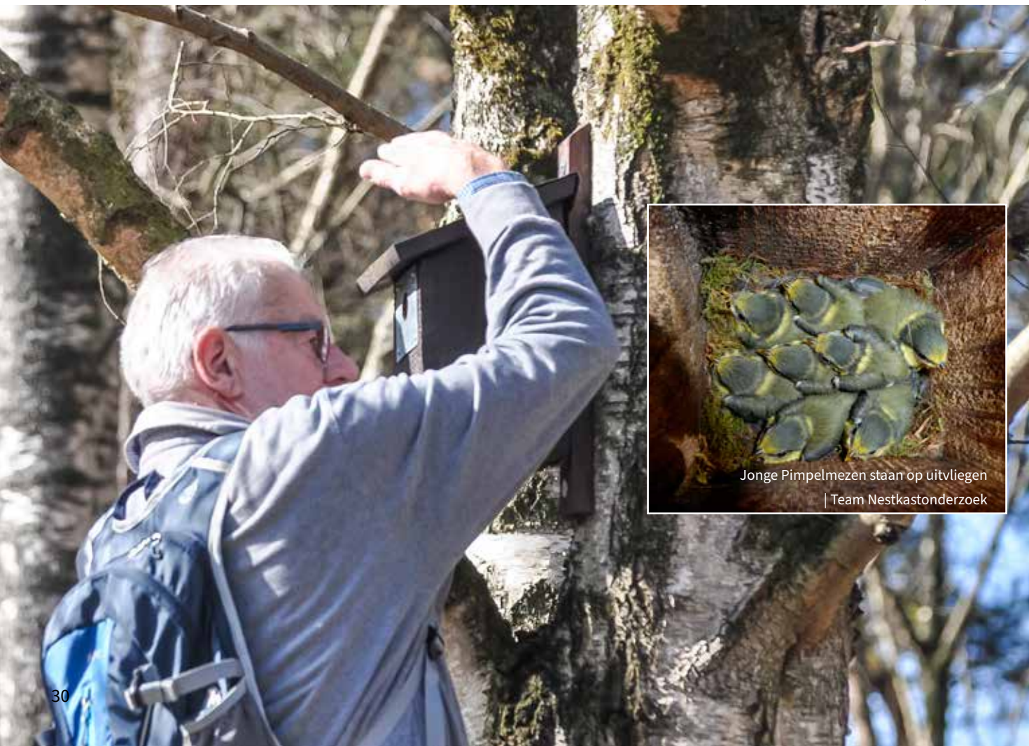
Jonge Pimpelmezen staan op uitvliegen | Team Nestkastonderzoek