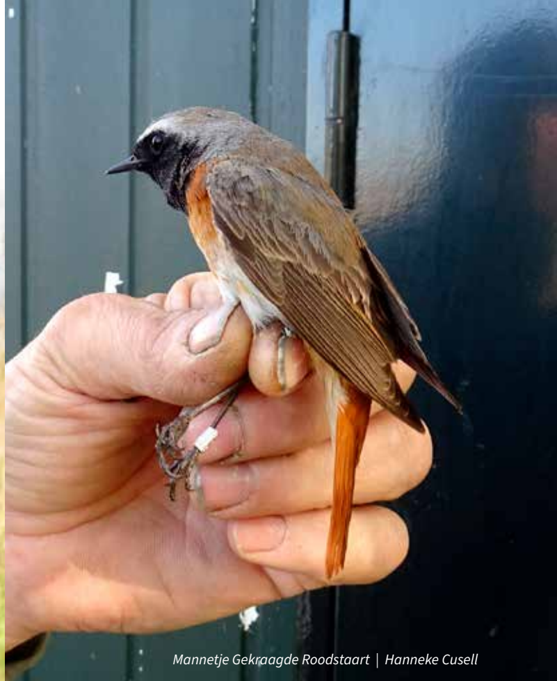
Mannetje Gekraagde Roodstaart | Hanneke Cusell

CES-methode. De banen bevinden zich in verschillende biotopen, een aantal in riet- en moerasland, andere in een meer open veld-structuur of op de overgang van struweel naar bos. Deze biotopen moeten door de jaren heen zoveel mogelijk gelijk gehouden worden. Buiten de CES-banen zijn er nog andere, 'wilde' banen. Dat aantal is afhankelijk van hoeveel mensen er zijn. Op dit moment zijn er zo'n vier mensen nodig om de netten op te zetten en de vogels te ringen, maar vanaf half augustus zijn dat er meestal minimaal zes. Dan is het heel druk met alle uitgevlogen jongen en daarnaast trekvogels, die of weer vertrekken of hier juist aankomen uit noordelijke broedgebieden. Afgelopen jaar was de bemensing beperkt vanwege het coronavirus. Een tijd lang mocht er zelfs maar met twee mensen tegelijk bij het ringstation gewerkt worden.