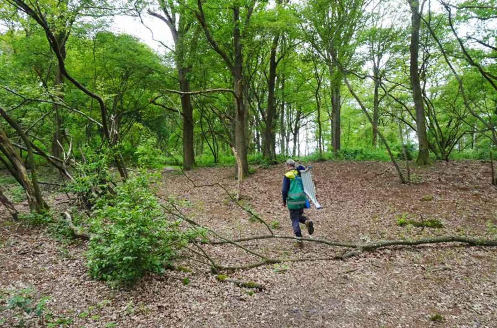
Heidebloem, 2-6-2023 | Hanneke Cusell

open te maken. Anders schrikken ze en vliegen ze eruit terwijl ze dat nog niet goed kunnen en dan kunnen ze 's nachts onderkoeld raken. Kool- en Pimpelmezen vliegen na 17 – 19 dagen uit en blijven dan nog een paar dagen in de buurt van de nestkast.