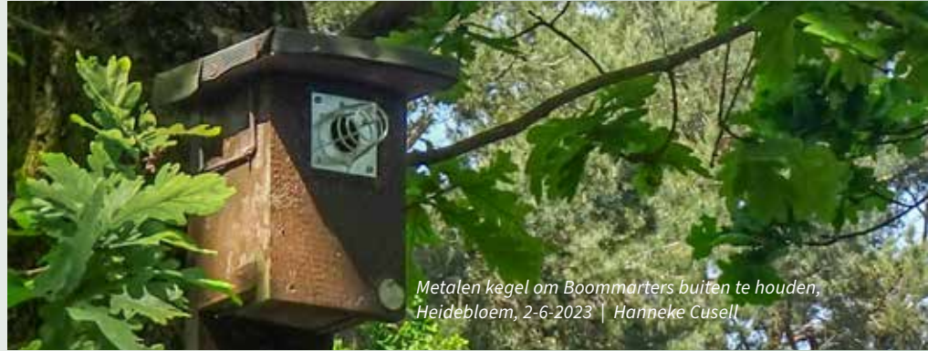
Metalen kegel om Boommarter buiten te houden, Heidebloem, 2-6-2023

Na tweemaal een korte pauze zijn vier uur later alle nestkasten gecontroleerd. Ook worden vanmiddag zo'n vijftien nestkasten schoongemaakt omdat de jongen uitgevlogen zijn of omdat de eitjes er al zo'n vier weken in lagen zonder dat er een ouder te zien was. Door het schoonmaken is dit de drukste periode. Een week later mag ik met Coby Jeninga mee om de nestkasten in Heidebloem te controleren; ook een gebied van GNR met 65 nestkasten. Het is een terrein met veel bramenstruiken en brandnetels, dus de oude broek en stevige schoenen die Coby had aangeraden zijn geen overbodige luxe. In een door een raster omgeven gebied, waar voorheen schapen graasden, zien we behalve nestkasten ook een eekhoortje en twee plekken waar duidelijk reeën hebben gelegen. Ook horen en zien we twee kleine