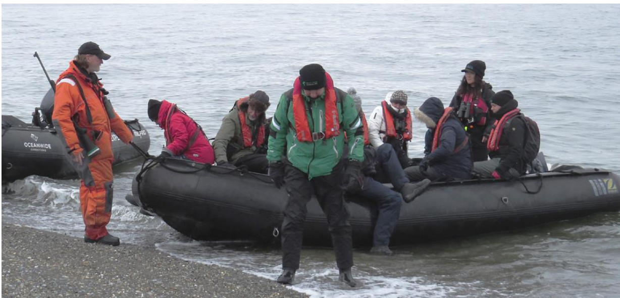
Met de Zodiac aan land