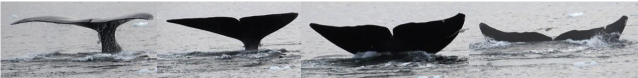
Staat van Groenlandse Walvis (beneden)