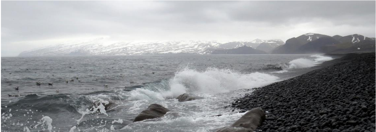
Jan Mayen (boven)