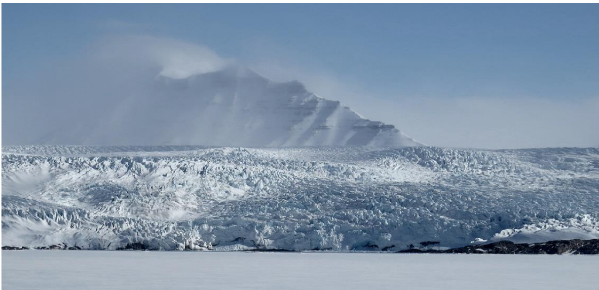
Gletsjer bij Pyramiden (beneden)